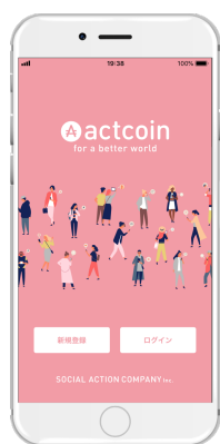
アプリ画面① (会員登録/ログイン)