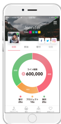
アプリ画面② (個人ページ)