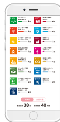
アプリ画面④ (SDGs 別内訳)