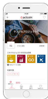
アプリ画面③ (プロジェクト詳細)